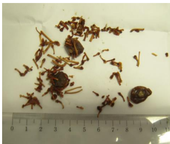
▲工場の選別工程で除去した枝